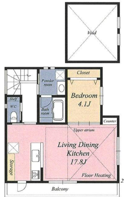
◎2Fリビング床暖房設置