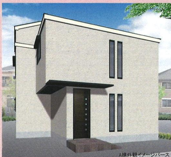
A棟外観イメージパース